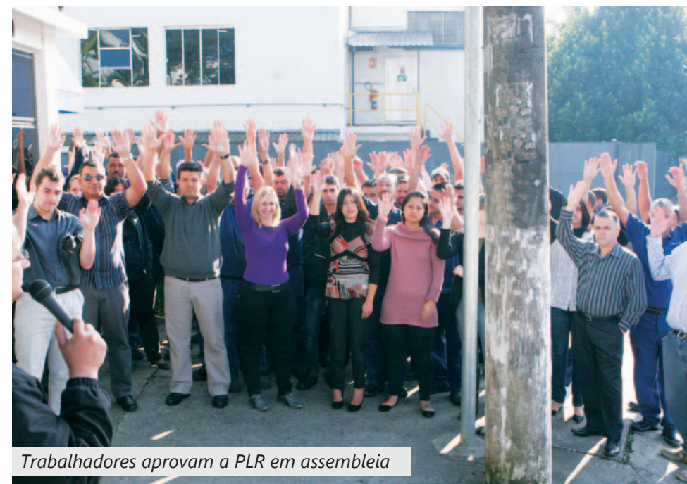
Trabalhadores aprovam a PLR em assembleia

Os trabalhadores da Grundfos, fábrica de sistemas de bombeamento em São Bernardo, aprovaram em assembleia na última quarta-feira a PLR para este ano.